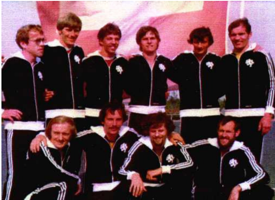
Mehrkampfgruppe Fricktal Schweiz 1979