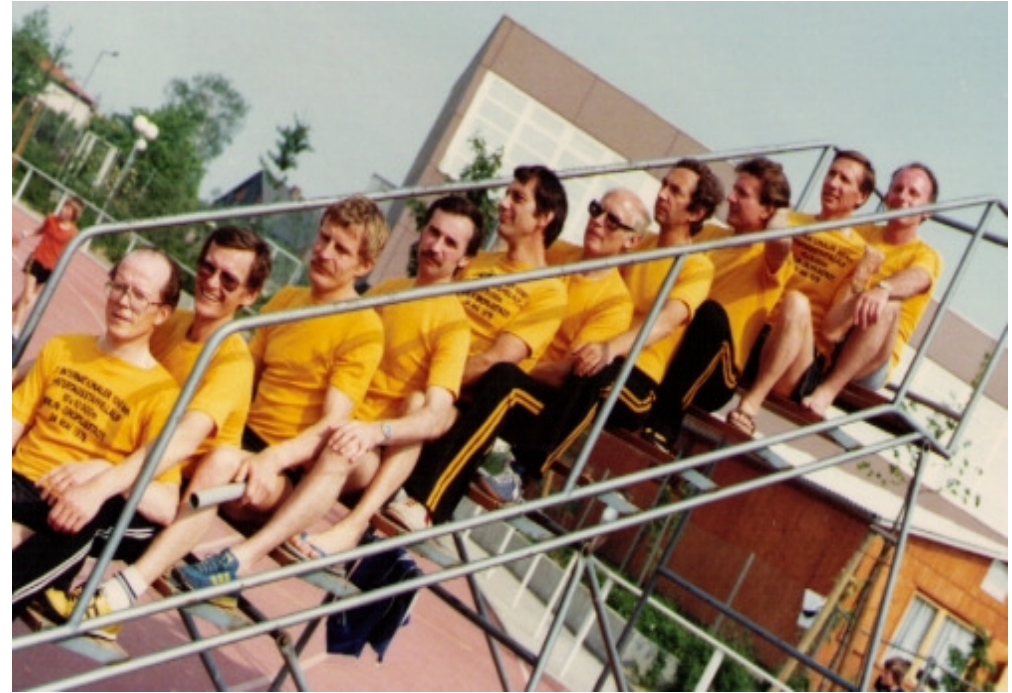
Berliner - Sport - Club 1979